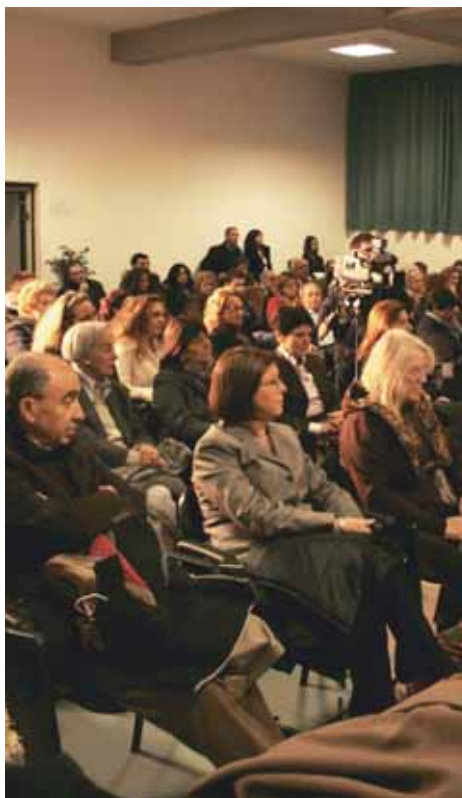
Il pubblico presente in sala