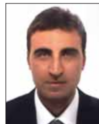
Vincenzo Del Duca